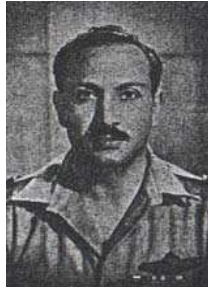
عبد اللطيف البغدادي